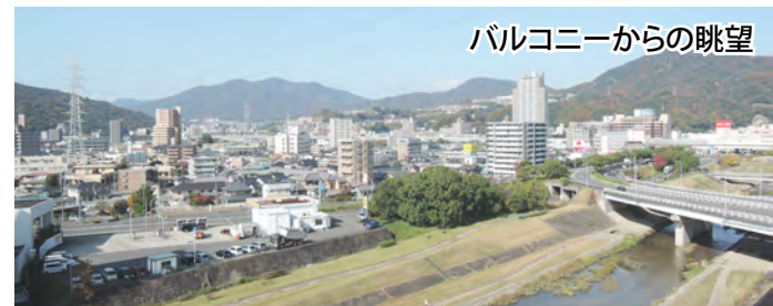
バルコニーからの眺望