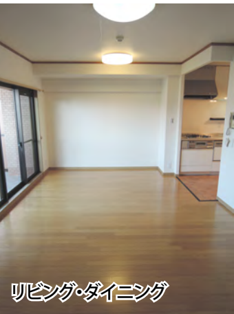
リビング・ダイニング